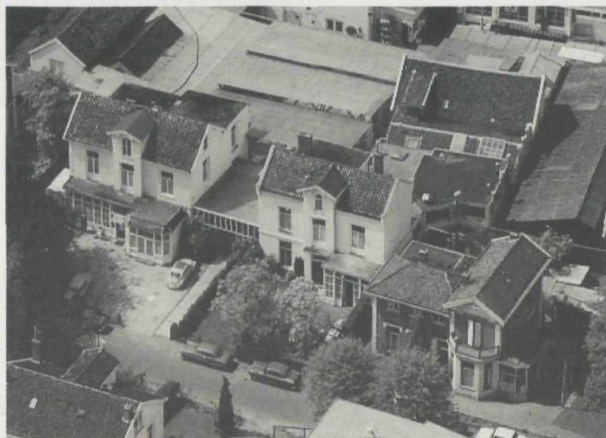
Villa Duma, Mollerstraat 11 (1e witte villa van rechts)

en onder de grond geschoffeld. Om het maar eens in het Latijn te zeggen: 'Sic Transit Gloria Mundi' oftewel in goed Amsterdams: 'Alles gaat naar de ratsmodeel!'