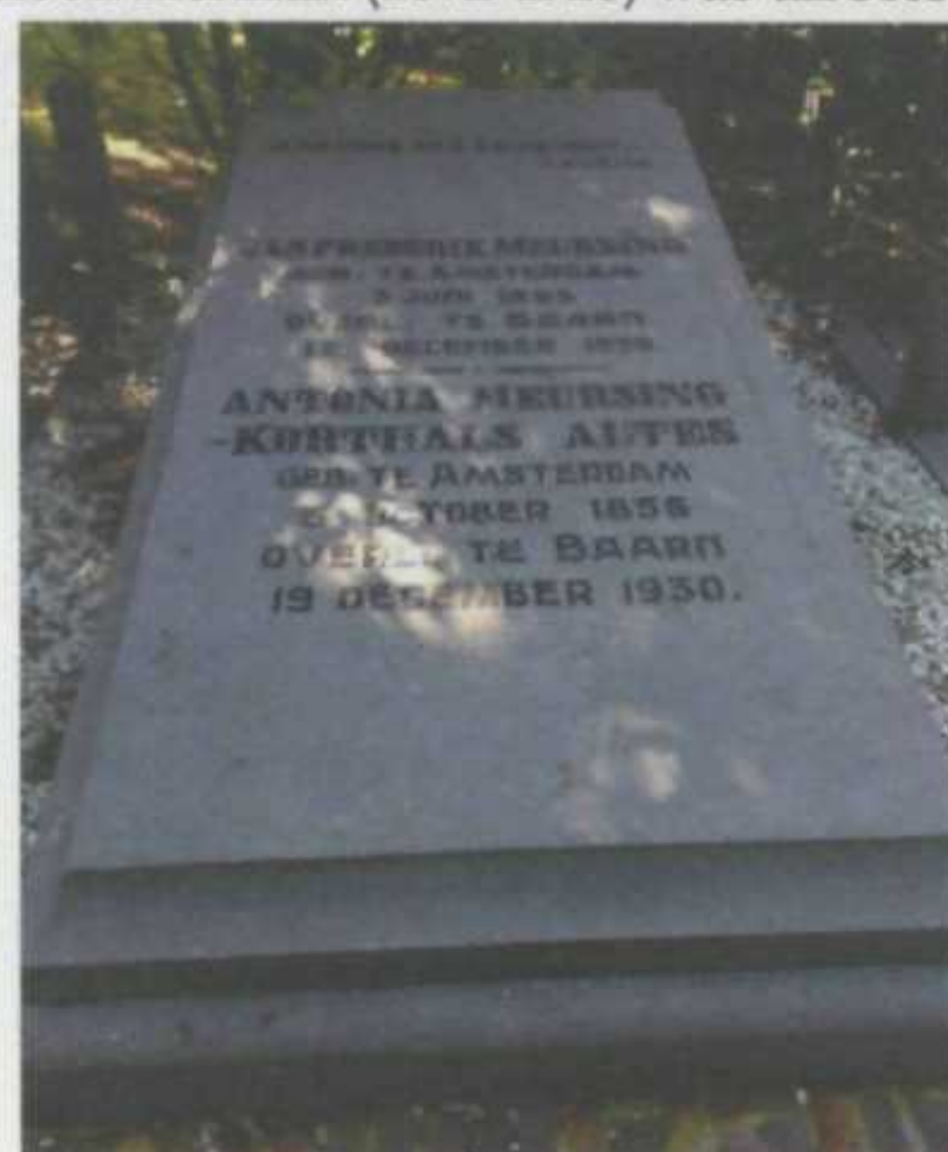
Voor altijd samen